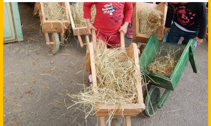
DES BROUETTES DE FOIN