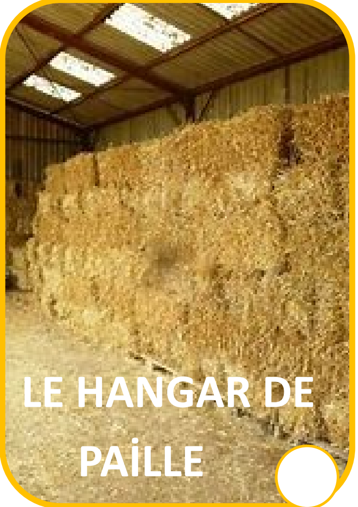
LE HANGAR DE PAÏLLE