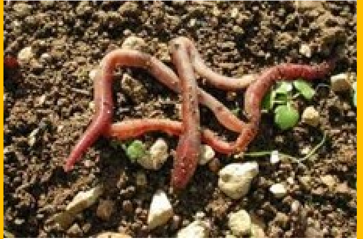
LES VERS DE TERRE