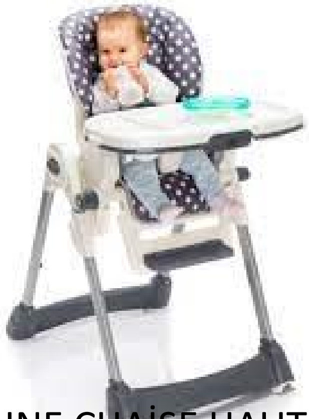
UNE CHAÏSE HAUTE