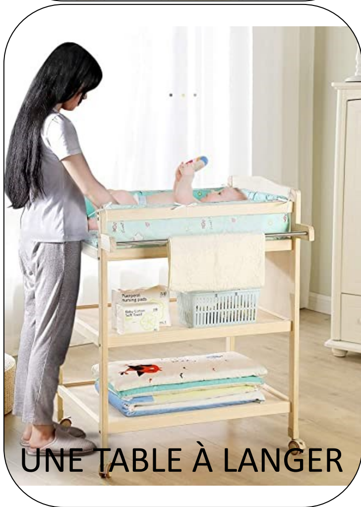
UNE TABLE À LANGER