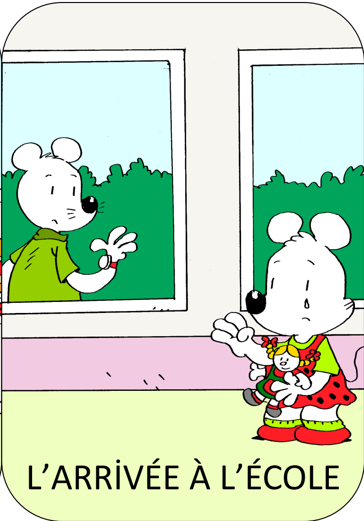
L'ARRIVÉE À L'ÉCOLE