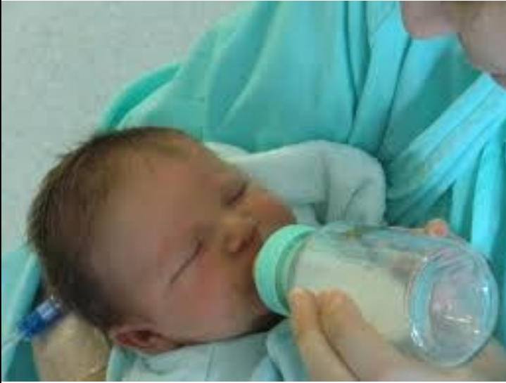
DONNER LE BÏBERON