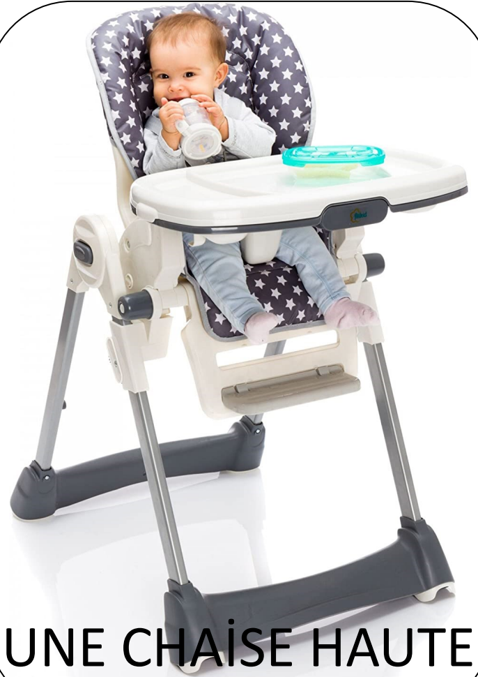
UNE CHAÏSE HAUTE