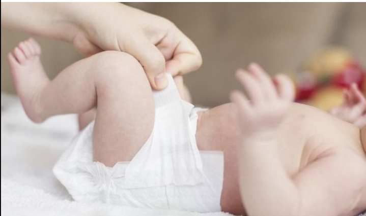
CHANGER LA COUCHE