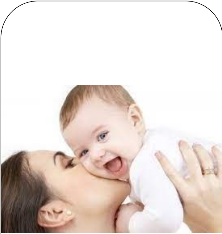
EMBRASSER / BISOU