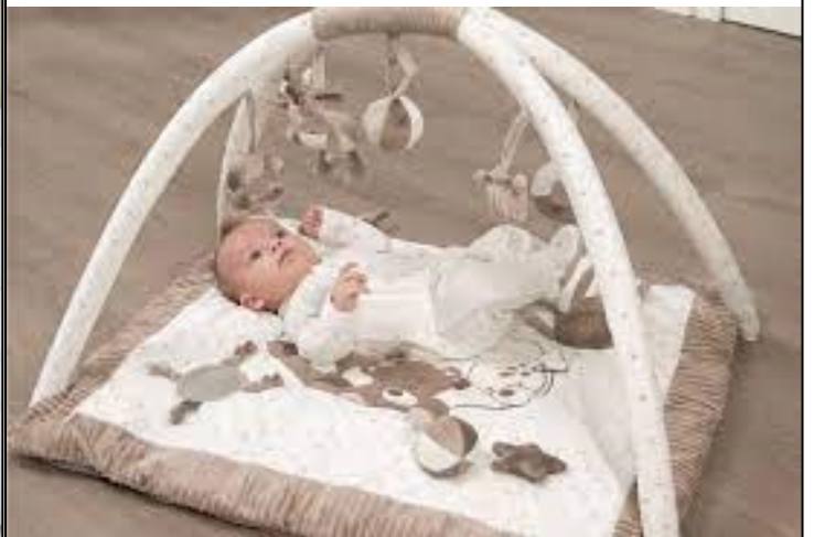
UN TAPIS D'ÉVEÏL