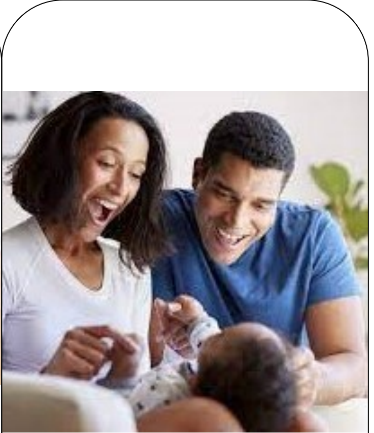
SOURIRE ET PARLER